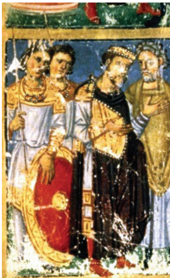
Tab. II - 1. Spiaci cisár Konštantín I. a kandidatoi /Sleeping emperor Constantine I and kandidatoi . List/Folio 440r, Paris, Cod. gr. 510, Bibliothèque National. GASTGEBER, Die Heilige Lanze, s. 54, obr. 2/page 54, fig. 2; 2. Stojaci cisár Julián Apostata a kandidatoi /Standing emperor Julian the Apostate and kandidatoi . List/Folio 374 v, Paris, Cod. gr. 510, Bibliothèque National. D'AMATO, Byzantine Imperial , obr. na s. 31/fig., page 31.