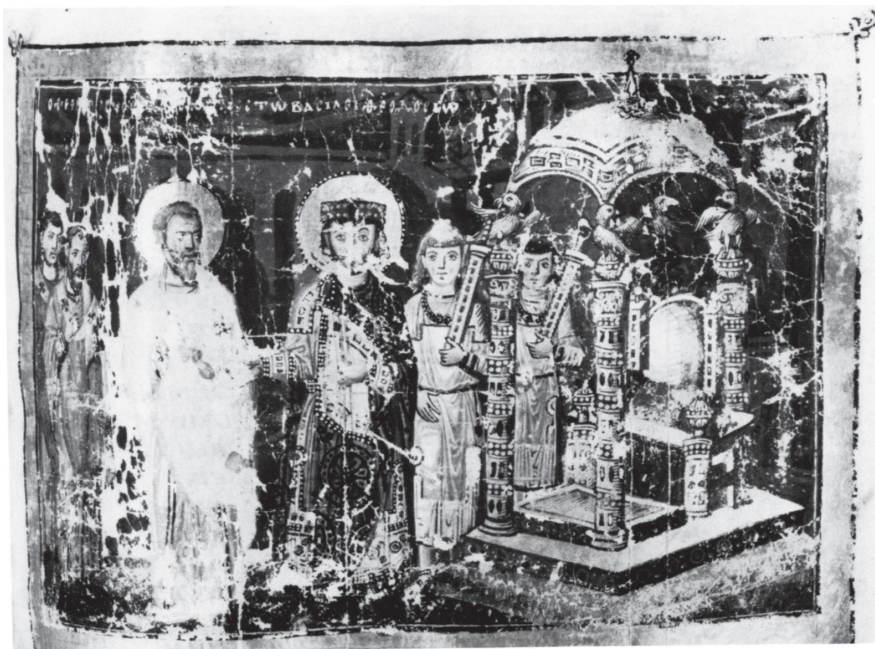
Tab. III - 1. Cisárovná Helena v scéne znovuzískania Kristovho kríža a protospatharioi / Empress Helena in a scene of the recovery of Christ's cross. List/Folio 440 r, Paris, Cod. gr. 510, Bibliothèque National. GASTGEBER, Die Heilige Lanze , s. 54, obr. 2/page 54, fig. 2; 2. Cisár Theodosius I. v rozhovore s biskupom Gregorom z Nazianzu a protospatharioi / Emperor Theodosius I in conversation with the bishop Gregory of Nazianzus. List/Folio 239 r, Paris, Cod. gr. 510, Bibliothèque National. KOLIAS, Byzantinische Waffen , tab. IX: 1.