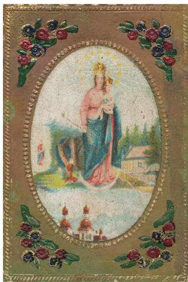
Obr. 4 Panna Mária Frýdecká a kaplnka s prameňom liečivej vody v Hájiku, drobná devočná grafika – pamiatka z púte (19. storočie) / Fig. 4 Our Lady of Frýdek with the chapel and the spring of the healing water in Hájek, the devotional graphic – the pilgrimage souvenir (19th century).