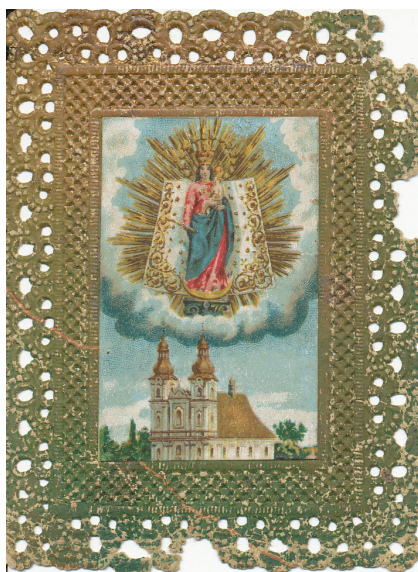
Obr. 3 Panna Mária Frýdecká, drobná devočná grafika – svätý obrázok s torzom čipkovaného okraja (19. storočie) / Fig. 3 Our Lady in Frýdek, the devotional graphic with the lace border torso (19th century).