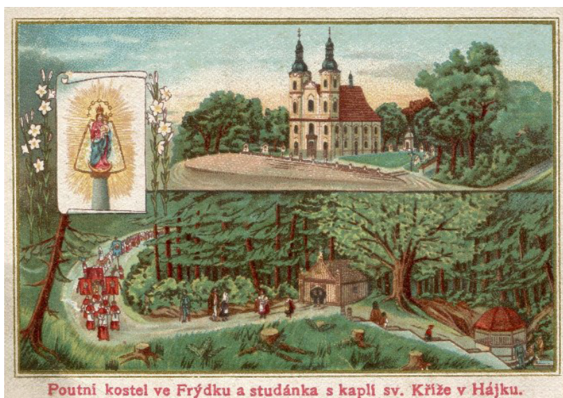
Obr. 2 Pohľadnica Pútnický kostol vo Frýdku a studnička s kaplnkou v Hájkju (2. polovica 19. storočia) / Fig. 2 The Postcard of the Pilgrimage church in Frýdek and the spring with the chapel in Hájek (2nd half of 19th century).